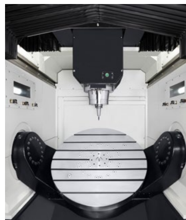
Takumi U 800: Komplett gekapselter Bearbeitungsraum